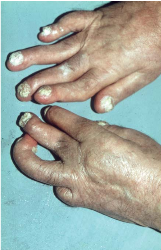
Psoriasis-Arthritis mit einer Psoriasis der Nägel

Leflunomid kann alleine oder in Kombination mit MTX eingesetzt werden.