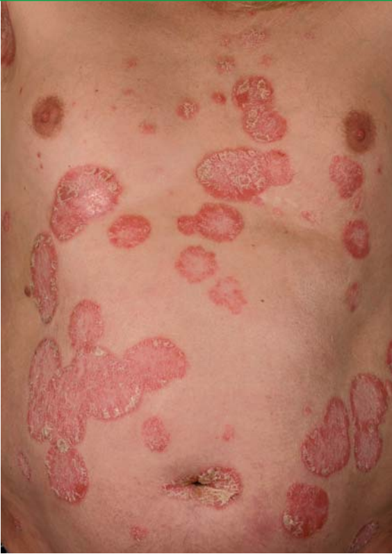
Typisches Bild einer Psoriasis vulgaris

verstreuter Hautausschlag, häufig begleitet von Juckreiz. Die Herde sind stark gerötet und schuppen zunächst noch wenig. Bei 80 bis 90 Prozent aller Menschen mit Psoriasis vulgaris vergrößern sich im Lauf der Zeit die Herde an den verschiedenen Körperstellen sehr langsam und kontinuierlich und fließen zusammen. Die Herde entwickeln sehr dicke, fest haftende, gelblich bis silbrig glänzende Schuppen und können sehr groß werden. Es gibt Körperstellen, an denen eine Psoriasis vulgaris besonders häufig auftritt. Diese Stellen werden medizinisch als Prädilektionsstellen bezeichnet. Dazu gehören behaarter Kopf, Ellenbogen, Kniescheibe und Gesäß. Charakteristisch ist auch die Erkrankung des Bauchnabels und zwischen den Pobacken (Analfalte). Es können aber auch alle anderen Körperfalten sowie Hände und Füße erkranken. Lediglich die Schleimhaut ist nie betroffen. Psoriasis ist nicht ansteckend.