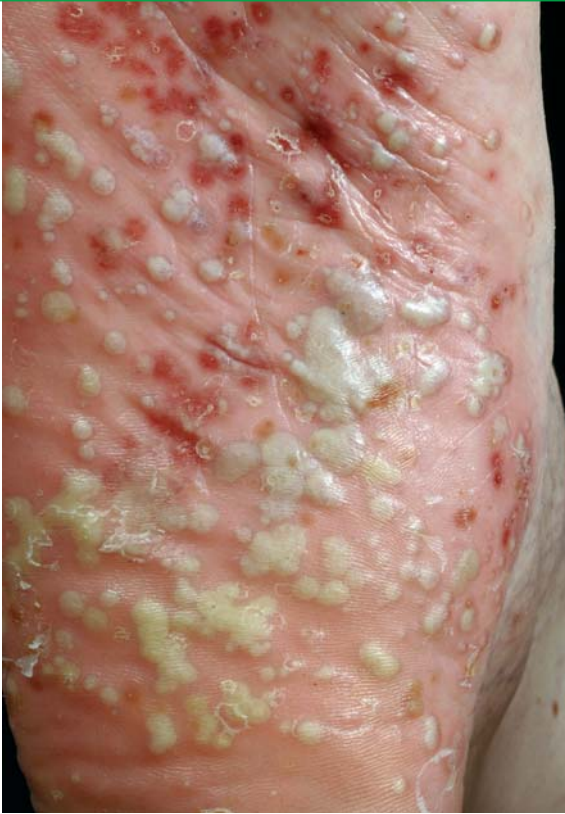
Palmo- plantare Pustulose an der Fußsohle

Eine Sonderform ist die über den ganzen Körper verteilte pustulöse Psoriasis (Psoriasis pustulosa generalisata). Diese Form gehört, wie die psoriatische Erythrodermie, zu den schwersten psoriatischen Erkrankungen. Es zeigen sich sehr schnell, innerhalb von Stunden, viele Pusteln auf entzündlich geröteter Haut. Die Pusteln sind großflächig über den ganzen Körper verteilt (generalisiert). Die meisten Patienten mit generalisierter pustulöser Psoriasis hatten vorher keine Psoriasis vulgaris als Grunderkrankung. Erkrankte sind im Allgemeinbefinden in der Regel stark beeinträchtigt, haben Fieber und fühlen sich abgeschlagen.